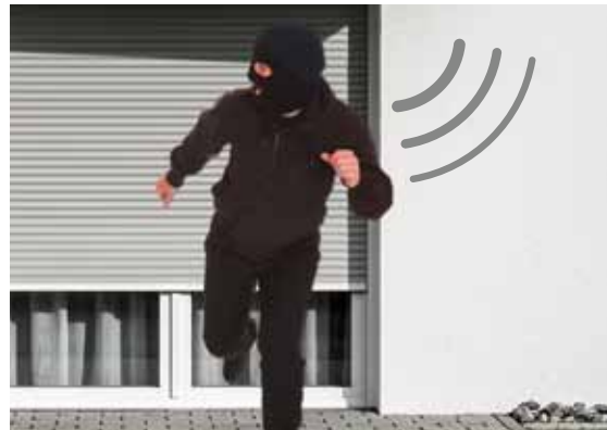
Sicherheitsstufe 3 Keine Gelegenheit für Diebe: Zusätzlich eingebaute GENIO Näherungssensoren